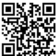
Exposants et nombres carrés