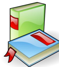
Illustration de mon livre.

☺ Merci d'accompagner votre enfant à compléter sa fiche de lecture.