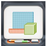
Base ten blocks