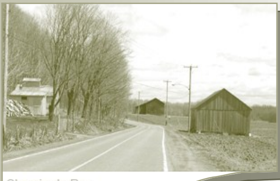
Chemin du Roy

Le chemin du Roy a servi au courrier et aux voyageurs qui utilisaient des calèches, des diligences et des carrioles d'hiver. On dit du chemin du Roy qu'il était le frère terrestre du fleuve. C'est Eustache Lanouiller de Boisclerc, le grand voyer de l'époque, qui a commencé les travaux sur le chemin du Roy en 1731 et ceux-ci se termineront en 1737.