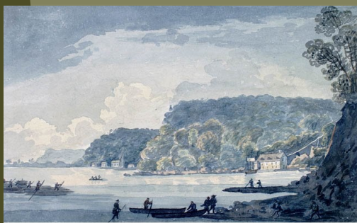
Vue de Saint-Augustin, sur le rive du fleuve Saint-Laurent - George Hériot circa 1837