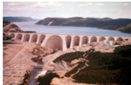
© Auteur inconnu / Québec en images / 21979